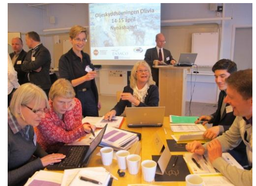
Table top övningar är ett enkelt och billigt sätt att öka kompetensen och stärka samarbetet mellan aktörer

Frivilligorganisationerna KfV Riks och Svenska Blå Stjärnan har utbildat över 200 volontärer samt deltagit i skapandet av en Östersjögemensam manual för hantering av oljeskadat fågel. Hantering av oljeskadat vilt har genom EnSaCo projektet förankrats i räddningstjänsternas och Kustbevakningens rutiner och nått väldigt goda resultat i Sverige. Det är viktigt att man upprätthåller och vidareutvecklar den kompetens som projektet skapat. Men det är olyckligt att vi fortfarande inte har klartgjort vilken myndighet som ansvarar för frågan i Sverige.