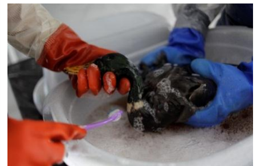
Hantering av oljeskadat vilt ska ingå i de kommunala oljeskyddsplanerna enligt ministerbeslut från Helcom. Sverige ligger långt efter grannländerna på detta område